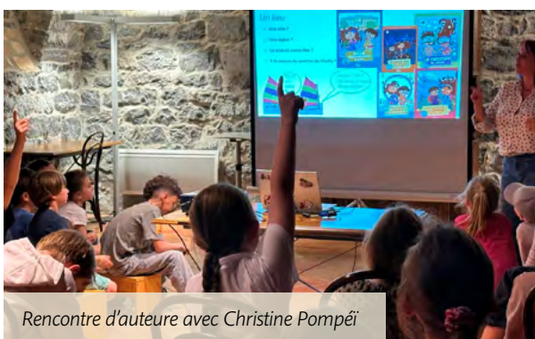
Rencontre d'auteur avec Christine Pompèi