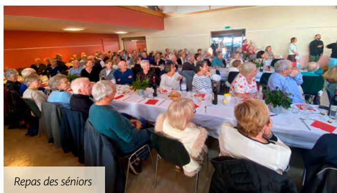
Repas des séniors