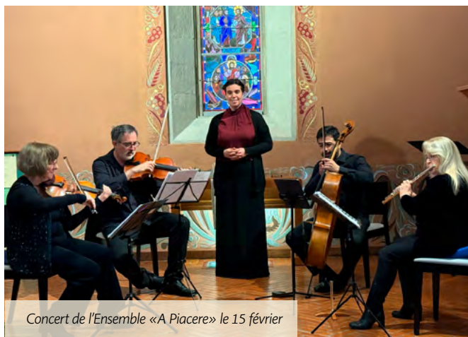
Concert de l'Ensemble «A Piacere» le 15 février