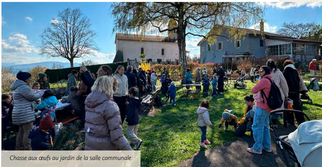
Chasse aux œufs au jardin de la salle communale