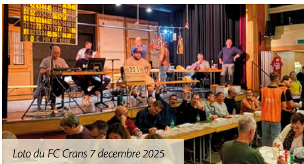
Loto du FC Crans 7 decembre 2025