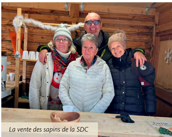
La vente des sapins de la SDC