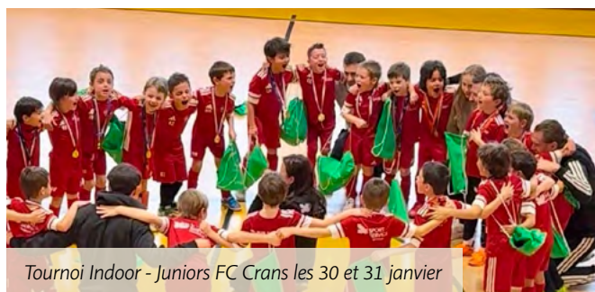
Tournoi Indoor - Juniors FC Crans les 30 et 31 janvier