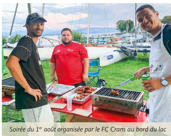
Soirée du 1 er août organisée par le FC Crans au bord du lac