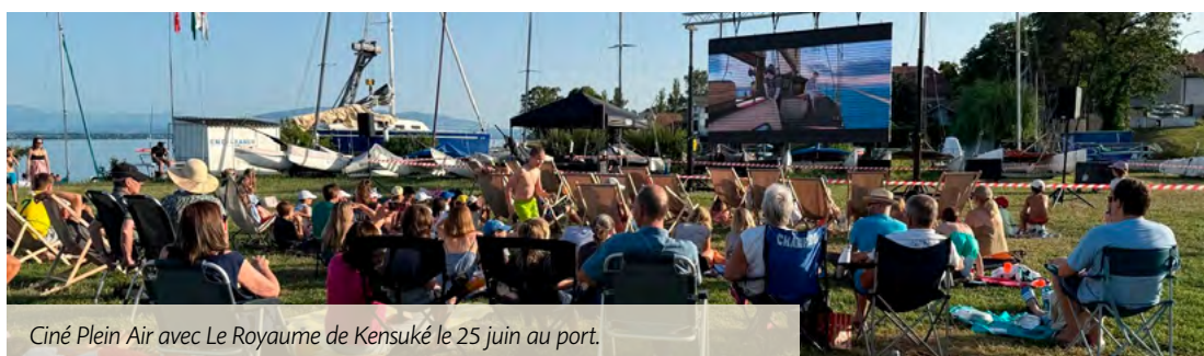
Ciné Plein Air avec Le Royaume de Kensuké le 25 juin au port.