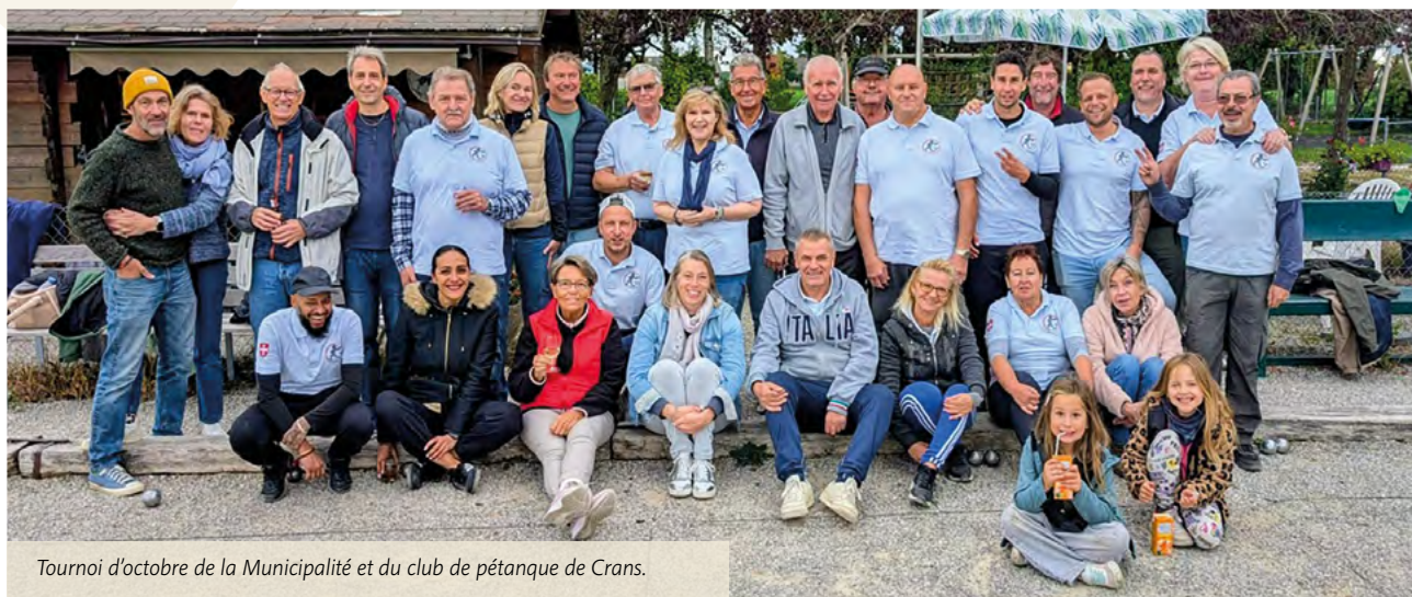
Tournoi d'octobre de la Municipalité et du club de pétanque de Crans.