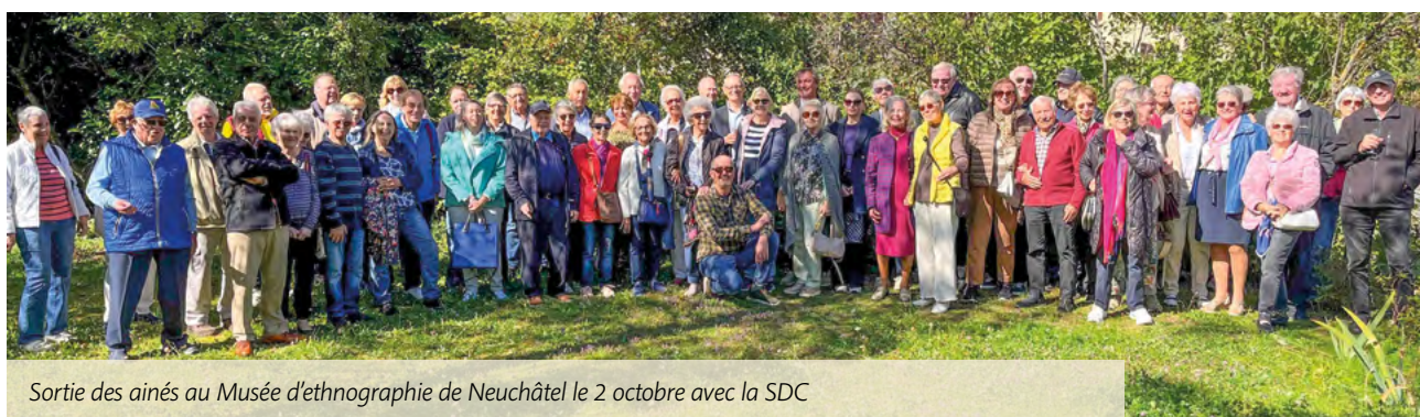
Sortie des aînés au Musée d'ethnographie de Neuchâtel le 2 octobre avec la SDC